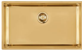
Spülbecken KE Gold 2157 859